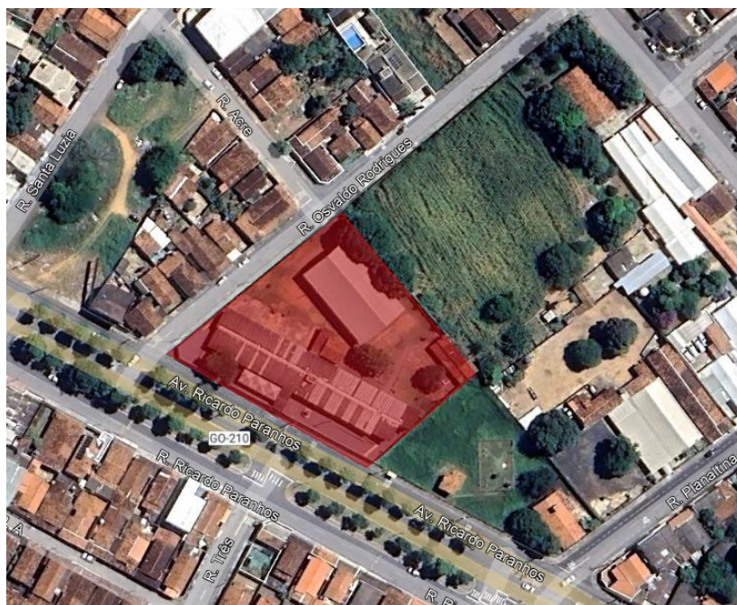
Figura 1- Google Earth

O presente projeto trata da estrutura do CEPI Abrahão André, em Catalão - GO, localizada na Av. Ricardo Paranhos, 634 - Pio Gomes, Catalão – GO, conforme ilustram as figuras 1 e 2.